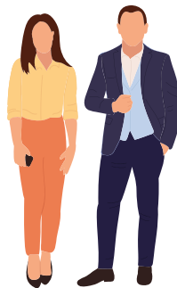
Vestimenta semi formal